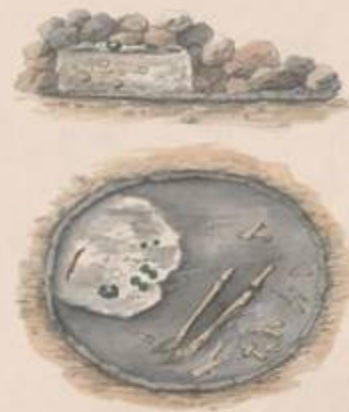
325 tes Grab

ein Leichenbrand, wenn der Entleib unverbraut beerdigt wurde.